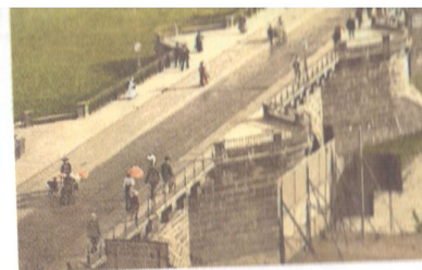
Dresden på eit postkort frå kring 1900. Kuppelen t